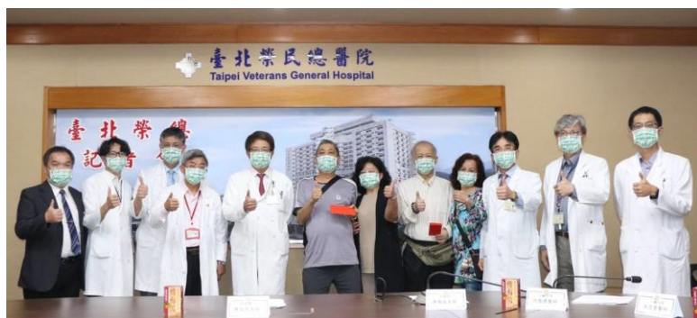
微創瓣膜置放術「免開心」治療心臟逆流新選擇