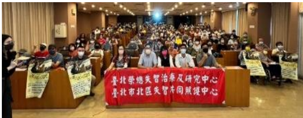
本中心主辦「有你相伴的旅程」失智症電影放映座談會活動照片

The goal of center is providing convenient and high-quality clinical treatments and community holistic care to dementia patients and caregiver.