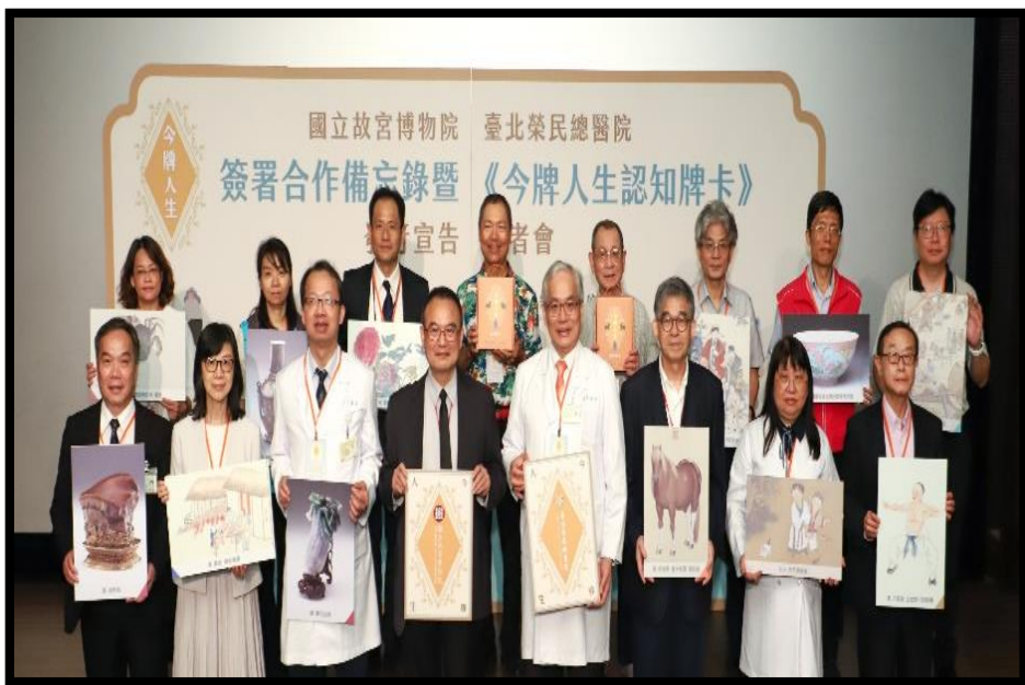
本院與國立故宮博物院簽署合作備忘錄