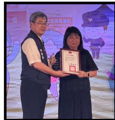
本中心獲臺北市衛生局評為「優良單位」