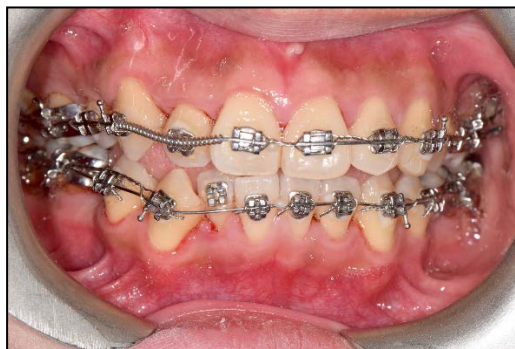
圖三、病患配戴傳統固定式矯正器