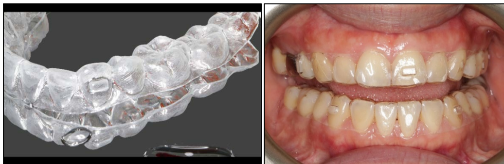
圖四、隱形牙套矯正美觀又舒適