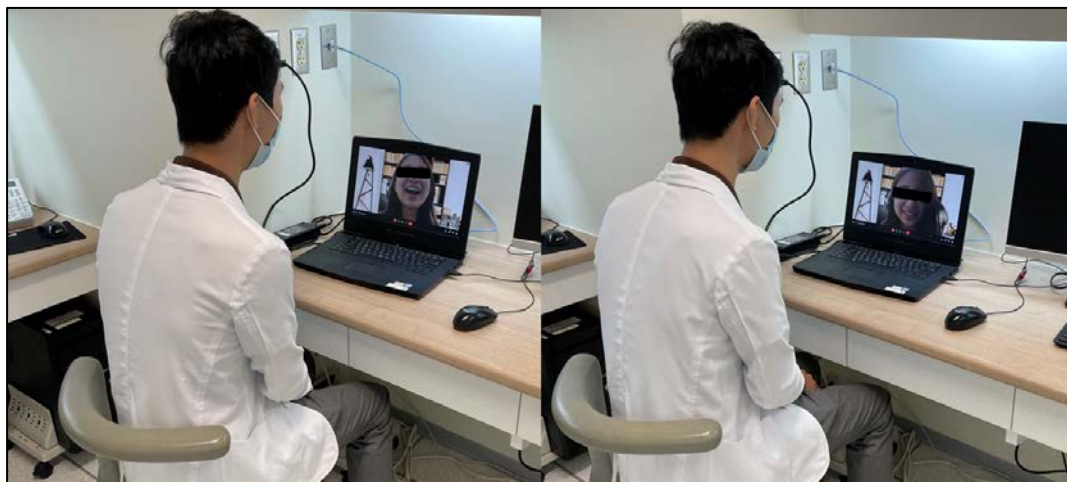
圖二、矯正醫師對病患進行視訊遠距看診，指導病患並追蹤牙齒變化。