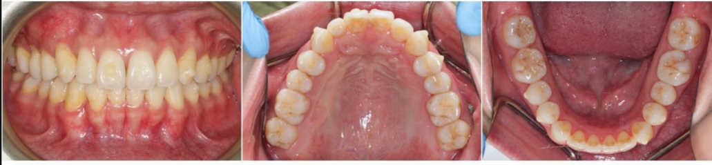
圖五、實際病患配戴隱形牙套治療的前後比較(口內)