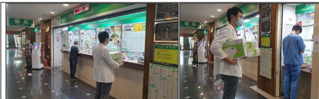
圖一、矯正醫師前往醫院郵局替病患寄送隱形牙套