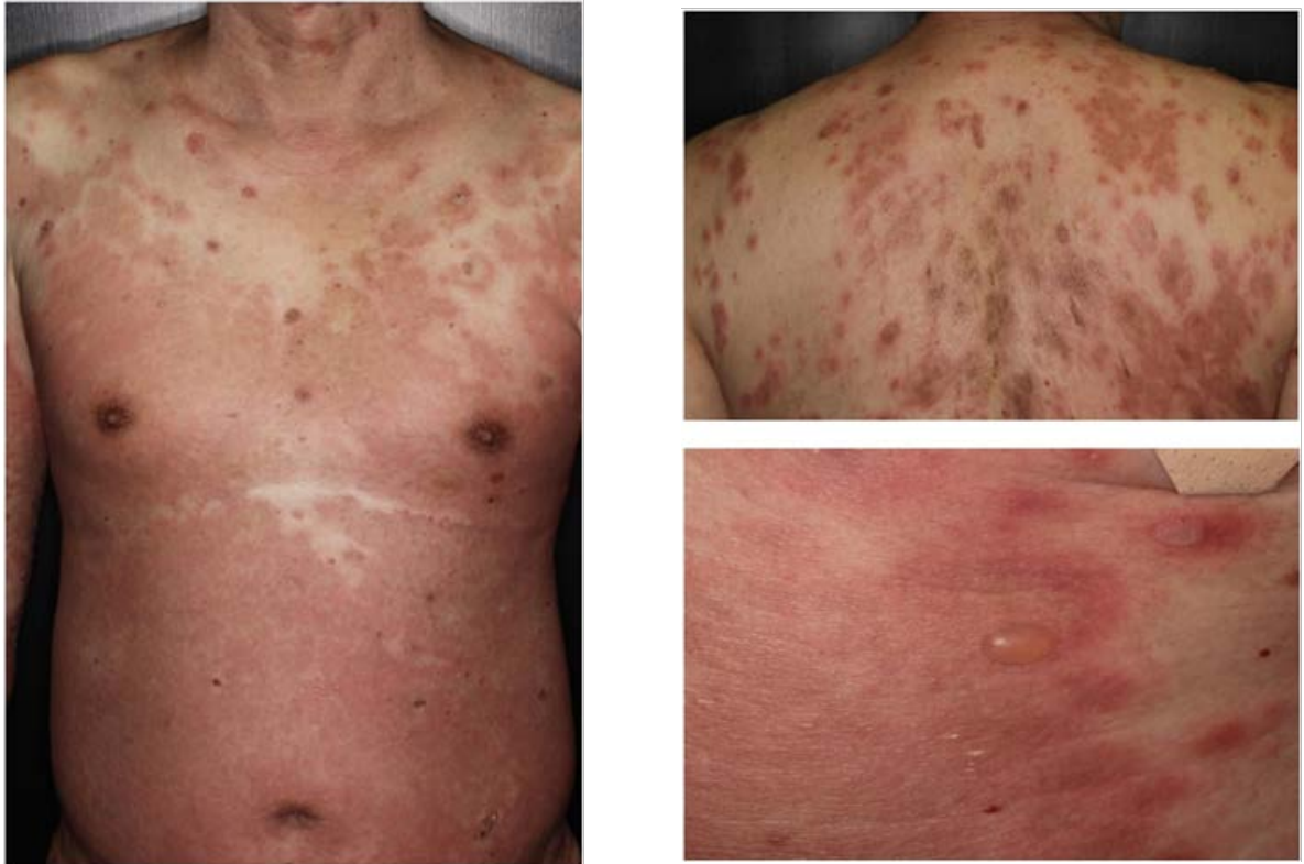
圖一「類天疱瘡」皮膚搔癢、水疱、破皮症狀