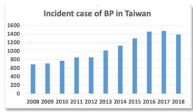
圖三「類天疱瘡」罹病人數逐年上升