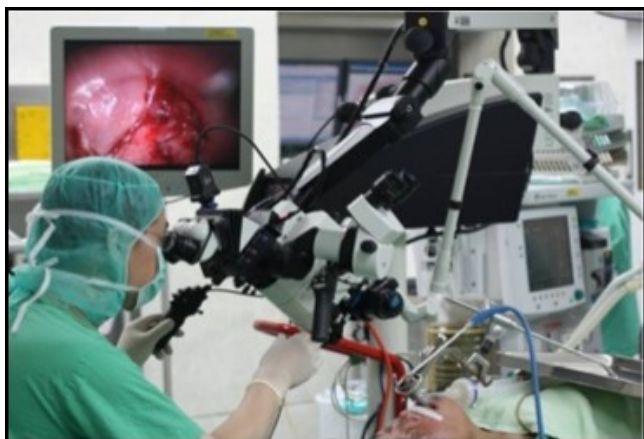
圖三：經口二氧化碳雷射顯微手術