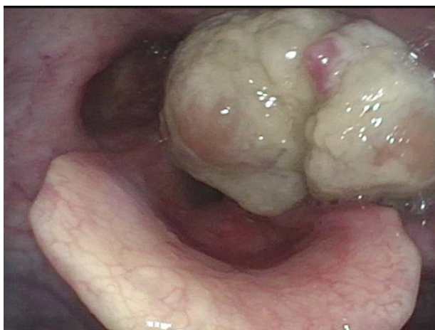
圖一：左側下咽癌腫瘤

接觸這些致癌因子，若有前述習慣，要盡快戒除，而頭頸癌病患約六成以上都有頸部腫塊，若有摸到頸部有異狀，也請立即就醫，期能確定診斷，及早治療。