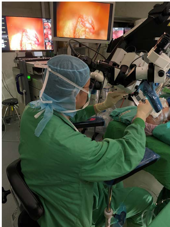
二氧化碳雷射顯微手術